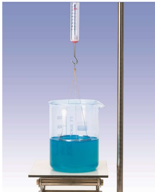
Fig. 3: Montaje de medición